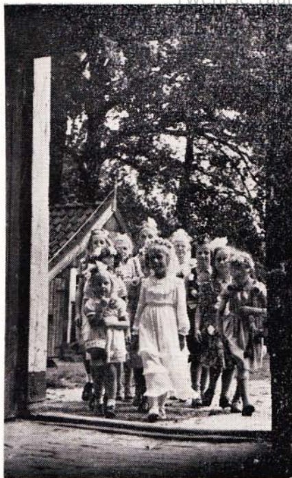
„De Pinksterbroed koop!”

„Als die Bisschop dat wereldlike sweert an den Keiser hadde overgegeven, heeft de hartog van Gelder die drie hoofdsteden van Overijssel alsoo benauwt, dat sij niet eens buten de poorte dorsten komen. En die borgers van de steden ende de ingesetenen van de landen waren voir die schulden beswaert ende verbonden ende als sij nu op haer groot perickel uit de landen ende steden iewerts reis-